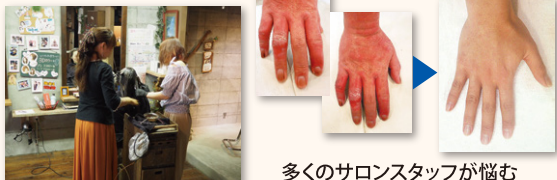
多くのサロンスタッフが悩む深刻な手荒れを改善!

「ダメージを気にするどころか、髪が生き生きツヤツヤしている」とお客様に好評です!以前は頭皮がただれてカラー出来なかったのが、“エコカラー”なら出来るようになったり、酷かったスタッフの手荒れも改善され、お店にとっても必要なものだと確信しました。