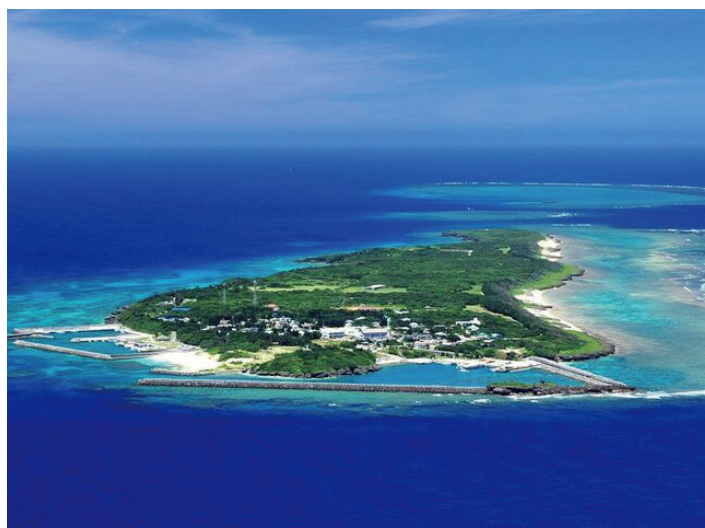
琉球王国開びやくの神アマミキヨが最初に作った島、久高島。「神の島」と呼ばれるこの島は、琉球神話の聖地であり、今もなお神秘的な雰囲気をたたえている